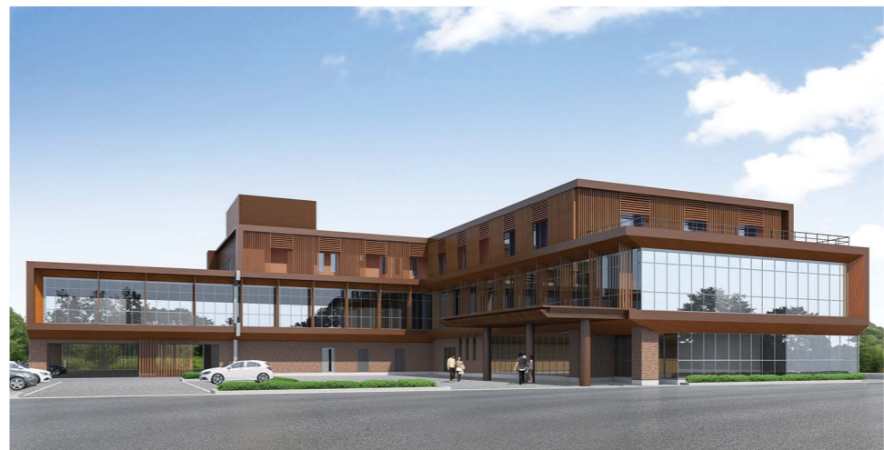
▲諸隈病院がリニューアルオープン！充実した医療、より患者様の気持ちに寄り添える地域医療を目指しています。