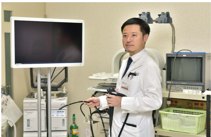
▲内視鏡やCTスキャンなどを使った日帰り人間ドックも行っています。