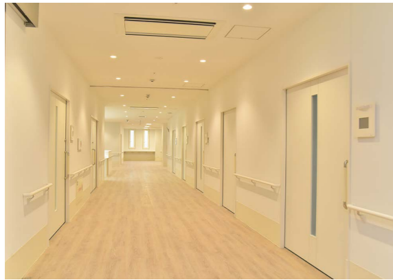
▲患者様一人当たりの病床面積は広く、全国でもトップクラス。

新たに創設された地域連携室の役割について伺いました。「地域連携室は患者さまの医療機関での受診や入院・転院がスムーズに